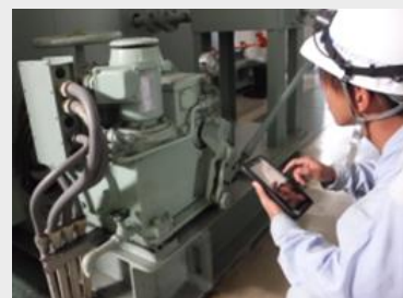
点検アプリを活用した作業風景